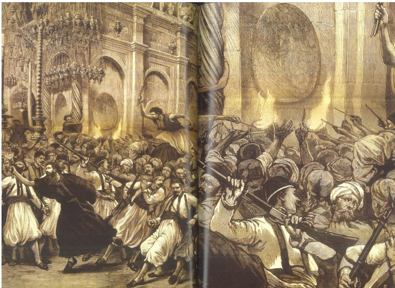
Έλευση του Αγίου Φωτός το Μεγάλο Σάββατο του 1878. Οι πιστοί σπεύδουν να ανάψουν τις λαμπάδες τους από τις φλόγες του Αγίου Φωτός που εξέρχονται από τις οπές του Παναγίου Τάφου (Εφημερίδα «The Graphic, Λονδίνο 21/09/1878)

Είναι πολύ σημαντική αυτή η μαρτυρία, επειδή προέρχεται από ένα μορφωμένο μουσουλμάνο. Αυτός βεβαιώνει ότι, το Άγιο Φως ανάβει από μόνο του μέσα στον κλειδωμένο Πανάγιο Τάφο, παρούσης της μουσουλμανικής ηγεσίας. Μάλιστα ο θρησκευτικός τους αρχηγός είναι εκείνος που ανάβει με το Άγιο Φως τις κανδήλες του τεμένους (Θόλου του Βράχου). Αναφέρει μάλιστα και το σημαντικό γεγονός, ότι στην αρχή το Άγιο Φως δεν καίει!