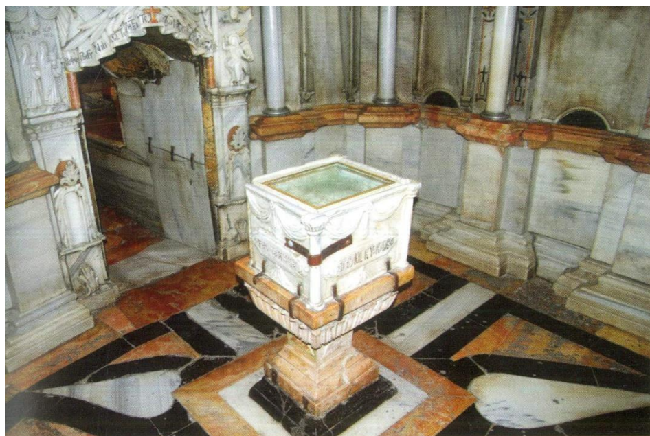
Ο προθάλαμος του Παναγίου Τάφου με τμήμα του «Αγίου Λίθου», τον οποίο απεκύλησε ο άγγελος.

Στο Πρώτο Μέρος προβαίνουμε σε ένα συνοπτικό Οδοιπορικό στην Αγία Γη , εξετάζοντας την μορφολογία του εδάφους, τις Γεωπολιτικές συνθήκες, με παράλληλη αναφορά και στην Ιστορία του τόπου. Στο Δεύτερο Μέρος αναφερόμαστε σε ορισμένες καταγεγραμμένες περιπτώσεις εμφανίσεων του Αγίου Φωτός (κατ'επιλογήν και με χρονολογική σειρά).