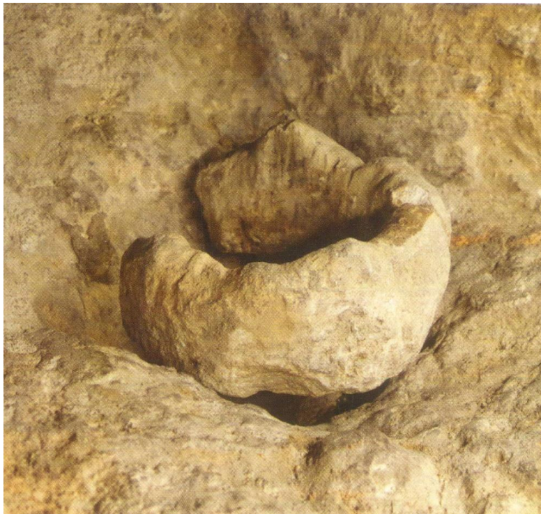
Ο λίθινος δακτύλιος, που βρέθηκε στις ανασκαφές του 1977. Διακρίνεται η οπή, μέσα στην οποία στερεώθηκε ο Σταυρός του Χριστού.

Πέρασαν από τότε σχεδόν δύο αιώνες, όταν κατά το έτος 1986 ο καθηγητής Γ. Λάβδας και ο Δρ. Θ. Μητρόπουλος, επικεφαλής της ανασκαφής, αποκόλλησαν αυτές τις μαρμάρινες πλάκες, για να διευκολυνθεί η ανασκαφική έρευνα. Τότε, μέσα στην οπή της Σταυρώσεως και σε βάθος 40 εκατοστών, ανακαλύφθηκε ένας λίθινος δακτύλιος με εξωτερική διάμετρο 19 εκατοστών. Αυτός μας γνωστοποιεί το ακριβές σημείο, στο οποίο στερεώθηκε ο Σταυρός του Χριστού! Κατά την περίοδο της ίδιας ανασκαφής, και σε απόσταση 1,23 μέτρων από το σημείο της Σταυρώσεως, βρέθηκε ένας κοσμικός σταυρός διαστάσεων 13X13 εκατοστά, χαραγμένος in fresco στο ίδιο επίχρισμα που είχε και ο δακτύλιος. Αυτό αποδεικνύει, ότι η Πρωτοχριστιανική Εκκλησία γνώριζε επακριβώς το σημείο της Σταυρώσεως, το οποίο και κάλυψε με επίχρισμα για να το προστατεύσει. Αυτό φαίνεται πως έγινε πριν από την ανέγερση του Forum του Ρωμαίου αυτοκράτορα Αδριανού το έτος 135 μ.Χ. με την τεράστια πλατφόρμα του, που σκέπασε τα Ιερά Προσκυνήματα.